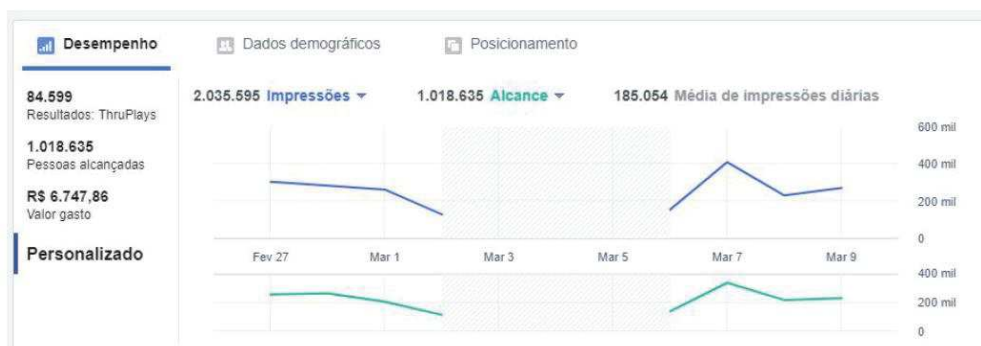
Figura 1 – Desempenho impressões x alcance

No período analisado a plataforma gerou um total de 2.035.595 impressões e 1.018.635 usuários únicos alcançados , resultando em uma frequência média de 2 impressões por usuário . Com a otimização configurada o resultado foi de 84.599 ThruPlays , sendo o custo médio por resultado de R$ 0,08 por ThruPlay .